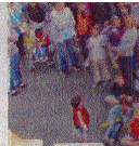
Une belle photo familiale

article Paris Normandie Duppe du samedi 23 août 2015